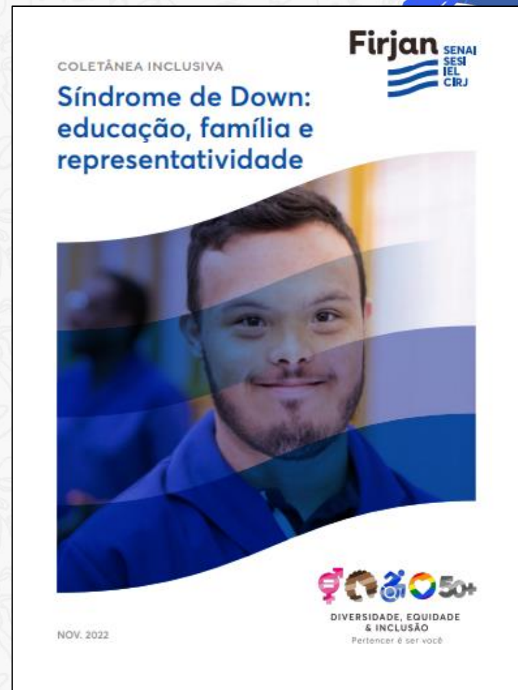
Síndrome de Down: educação, família e representatividade