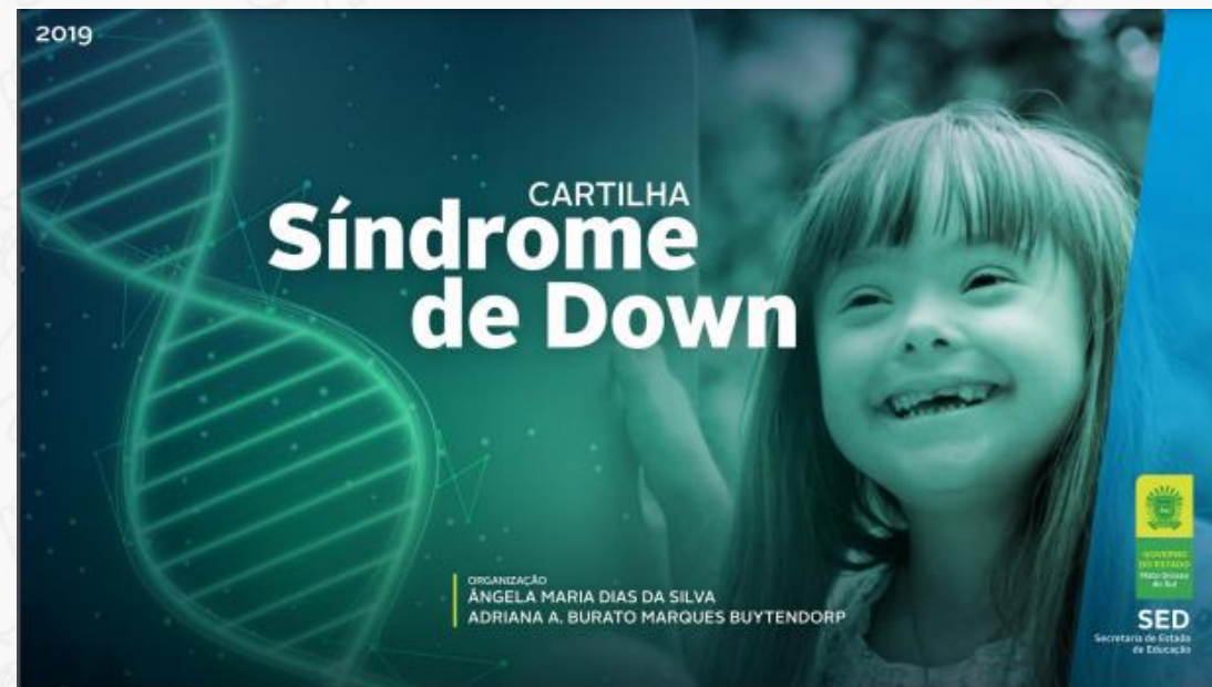
Cartilha Síndrome de Down